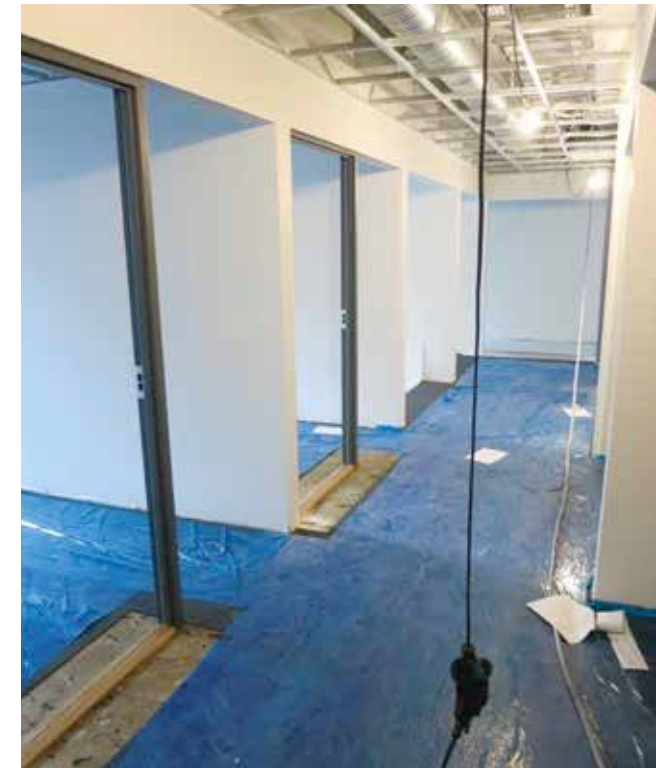
Kirkens ansatte får kontorer i kirkesenterets andre etasje.