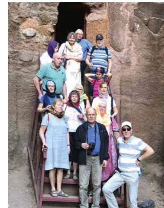
Turgruppa ved inngangen til en av grottekirkene i Lalibela. Kvinnene måtte ha tildekket hode og alle måtte plassere skoene på utsiden.

Lalibela er en fascinerende by opp i ei åsside med vidt utsyn over et mektig fjellandskap. Vi befant oss her nærmere 3000 moh. Historien forteller om kong Lalibela som på 1100-tallet besøkte Jerusalem. Da han vendte tilbake, begynte han å hogge ut grottekirker i sandsteinsfjellet her. De eldste ligger høyt oppe i fjellmassivet ovenfor byen, mens det i og rundt